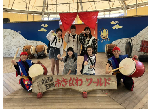
沖縄修学旅行（令和元年12月）